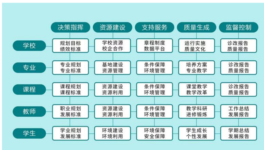
图 4-旅游管理专业教学质量保障体系

而下的管理队伍。教学管理队伍运行高效，实现教育教学管理工作科学化、规范化，提高教学管理水平、教学质量和办学效益，保证人才培养目标的实现。结合专业实际，根据教学规律和旅游行业人才需求的特点，从目标、实施、评价、改进等四个模块构建旅游管理专业完整的教学质量保证体系。该体系涵盖教学活动的全过程，并且在教学活动的各个环节中，为提高教学质量，提供全方位的帮助。